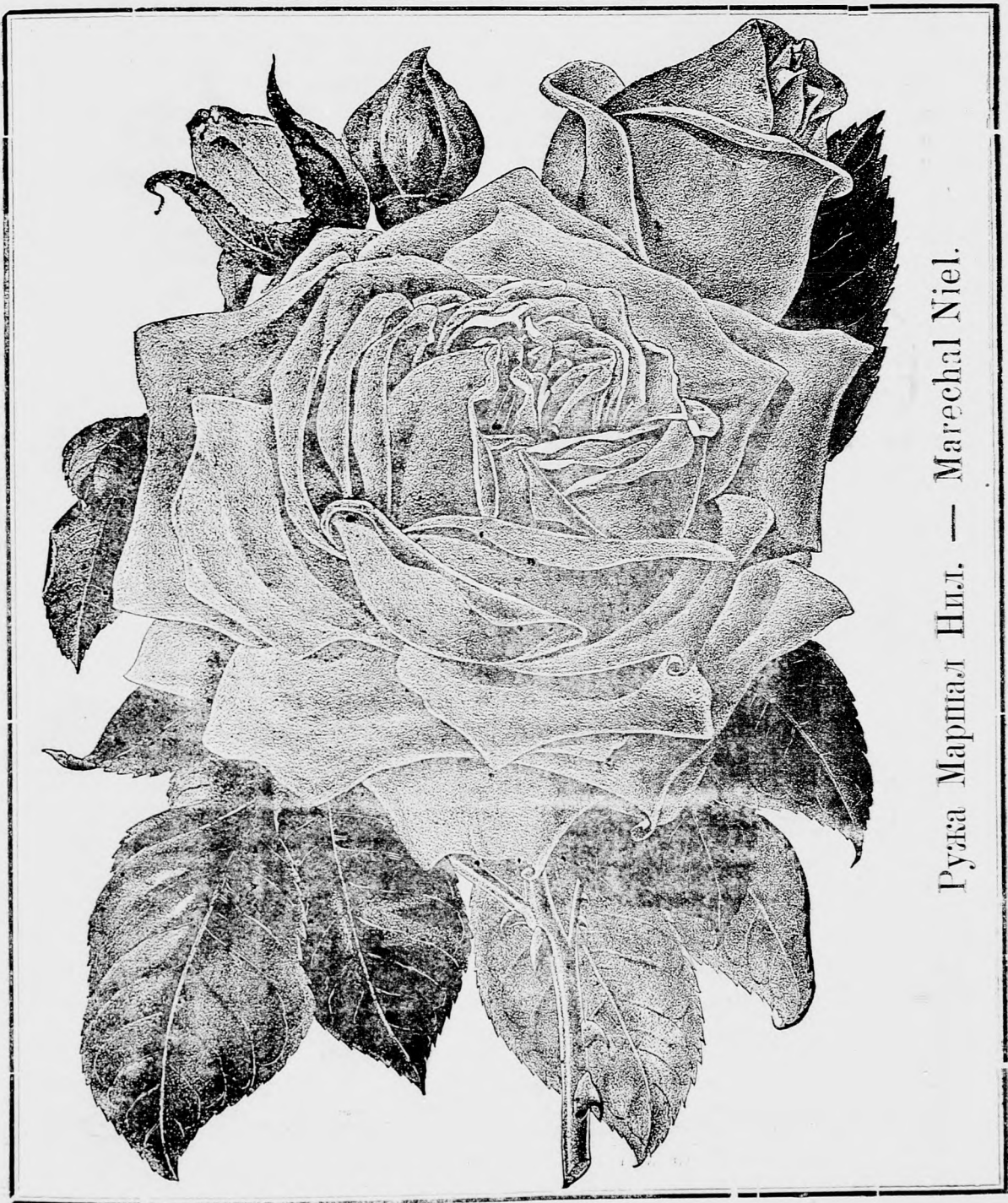
Ружа Маршал Нил. — Marechal Niel.

Једна нам слика показује како у слободи успева а друга како у лонцу изгледа.