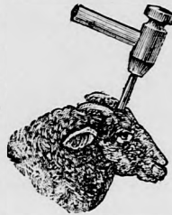
Сл. 47. Овца.

чине, те би се и ти људи разнежили, а по- ред тога, кад би над стоком нестао крвав нож, нестао би и међу људима тим најви- шим божијим створовима, а особито у оним слојевима, који по своме положају, по својој науци ваљало би да се нај- жешће против оваке дивља- штине свим си- лама боре, а оно на жалост ви- димо готово