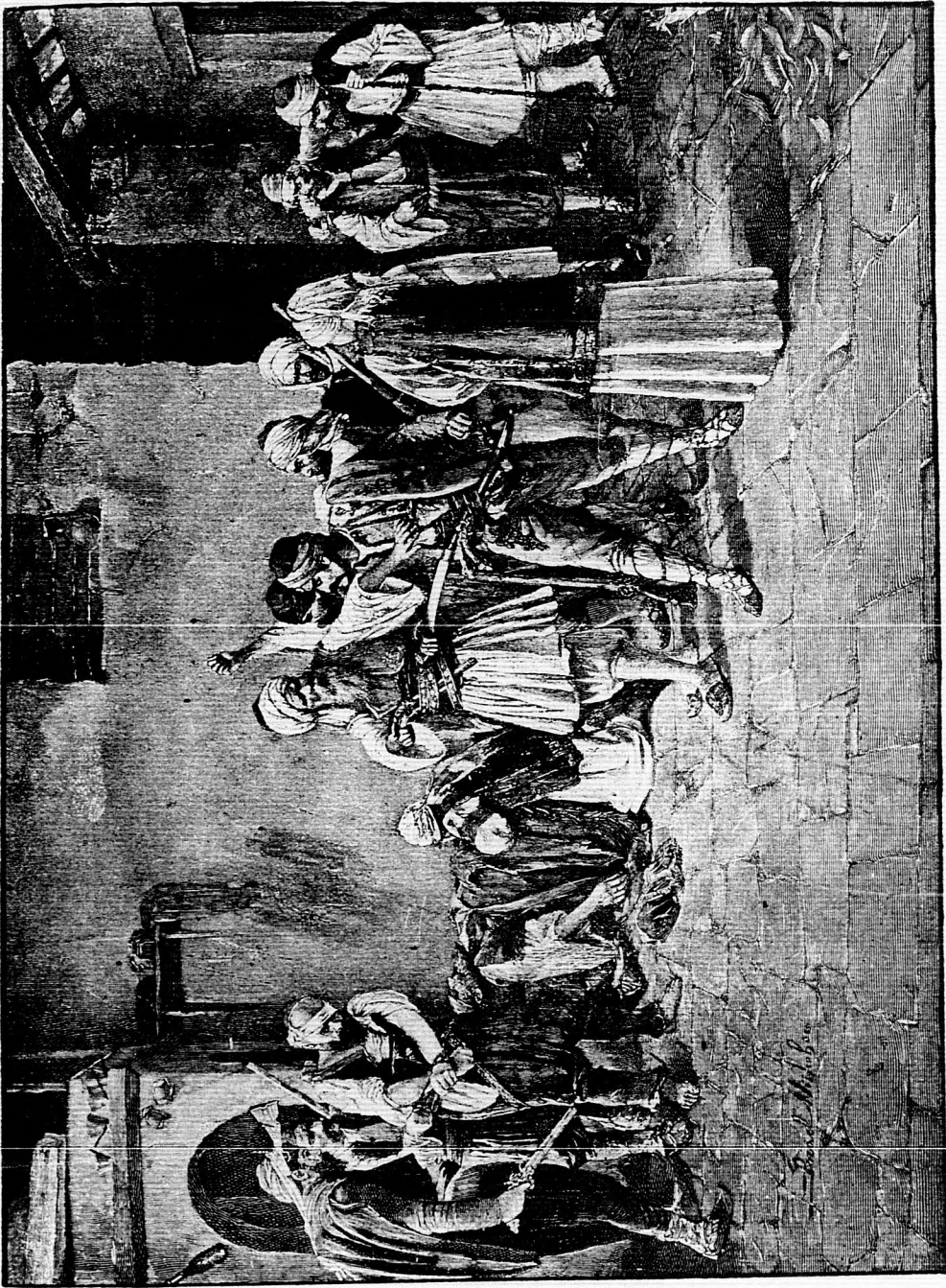
Itt a gyilkos!