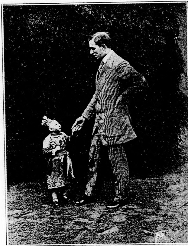
Tizenöt éves törpe leány.

Sokkal nagyobb mértékben használták a természetes rózsaszirmot a régiek. A rómaiak lakomáik alkalmával nemcsak önmagukat, serlegeiket és tányérjaikat díszítették rózsakoszorúval, hanem kitepték a rózsaszirmot s vastagon behintették vele az asztalt; a tálakat ugyyszólván rózsaszirmba ásták bele. Borukba is rózsaszirmot szórtak s úgy itták meg mindenestül. Néró császárról följegyezte a történelem, hogy egy külön szerkezet segítségével egyik híres lakomáján rózsaszirmosöt hullatott ven-