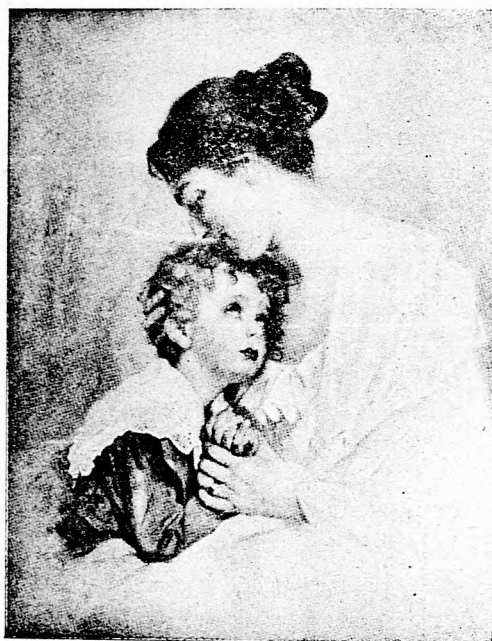
II. A nő igazi fensége.