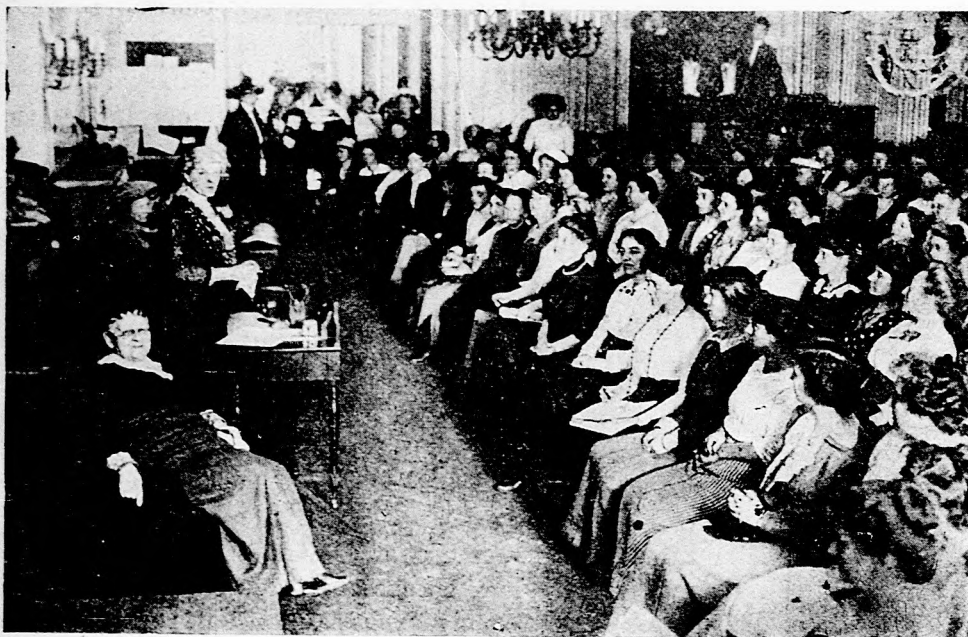
I. A szüffrazsett-iskola Londonban.