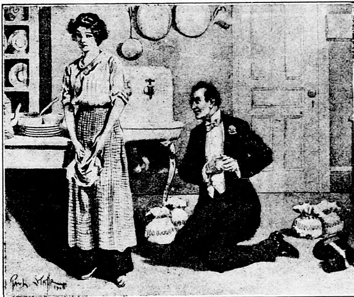
A vagyonos kérő behódol a házas lánynak.

Az alumínium szép, csaknem ezüstfehér fém, mely a levegőn nagyon kevésbé változik, nagyon jól nyújtható és ami legelőbb és legértékesebb tulajdonsága: nagyon könnyű; fajsulya 2.6. Az utolsó husz év alatt az alumínium használata nagyon elterjedt. Ezt az igen értékes fémet