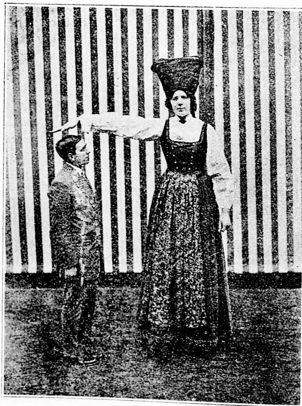
Tizenhat éves óriás leány.

Pankhurst asszonyt a sok izgatása és féktelenkedése miatt néhányszor elzárásra is ítélték, de mindannyiszor ki kell őt bocsájtani, mert ilyenkor világért sem vesz falatot szájába, mesterségesen sem tápláltatja magát, elgyengül . . . és mert