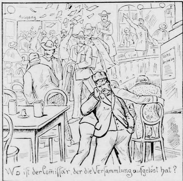
Wo ist der Commissar, der die Versammlung aufgelöst hat?