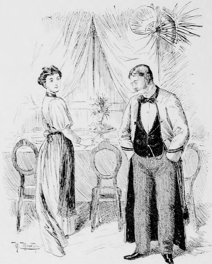
Macht der Gewohnheit.

Unterrichter (zu seiner Frau): Du, Riecke, wie viele Personen hast Du zu unserem heutigen Diner vorgeladen?