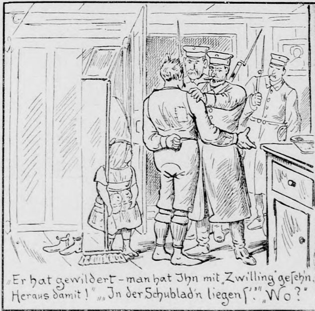
„Er hat gewildert — man hat ihn mit Zwilling gefesht. Heraus damit!“ „In der Schublad'n liegen!“ „Wo?“