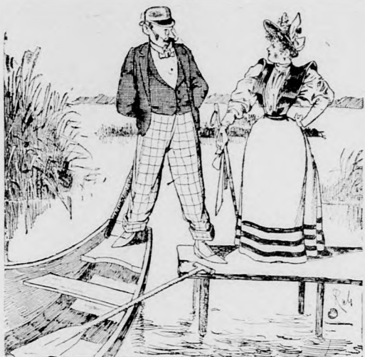
dann gehe ich lieber ins Hochgebirge, denn —