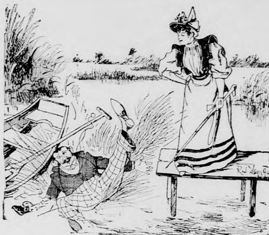
aus dem Wasser mache ich mir gar nichts!