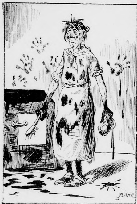
In der Wirklichkeit.