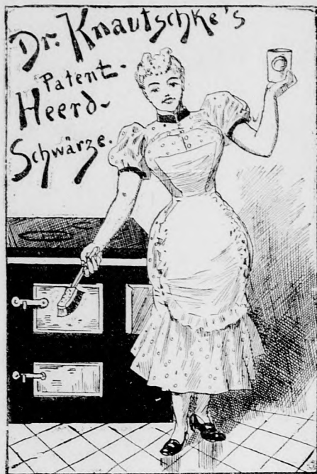
In der Reklame und