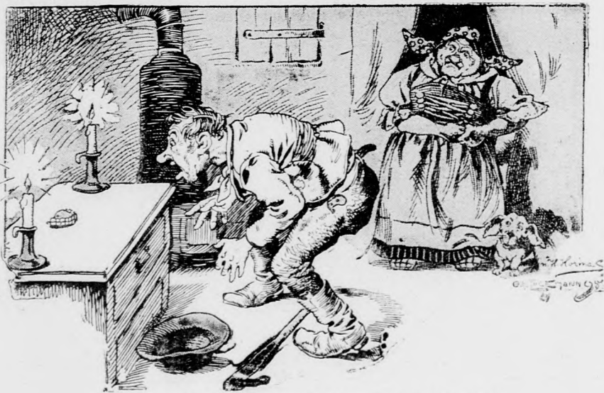
Wie die Nazenbäuerin diesen Rath befolgt!

Pfarrer: Wenn Euer Mann immer so spät heimkommt, Nazenbäuerin, müßt ihr ihm mal gehörig die Zähne zeigen!