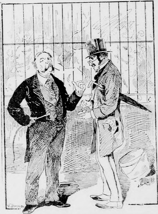
In der Menagerie.

Besucher: Was mag wohl dieser Löwe kosten? Menageriebesitzer: Der eine kostet 5000 fl., der andere aber ist mir um keinen Preis feil, denn er hat meine Schwiegermutter gefressen.