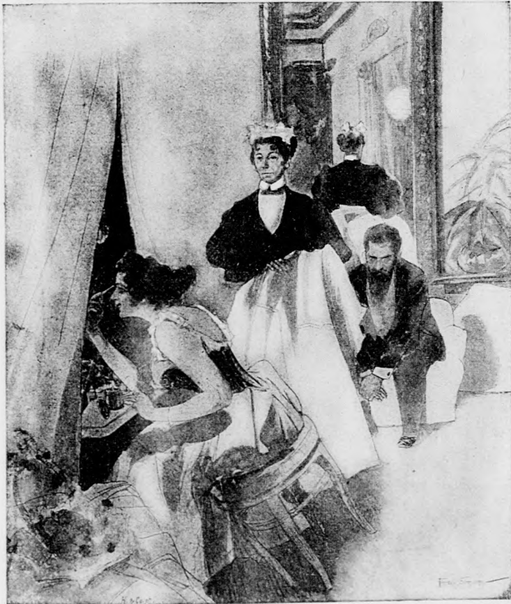
Ein vorzüglicher Ausweg.

Arzt (zu einer Operettendiva, die sich impfen lassen will): Soll ich Sie am Arm impfen, Fräulein? Diva: Bewahre, Herr Doktor, bedenken Sie doch, ich bin Künstlerin. Sie müssen mich an einer Stelle impfen, wo man's nicht sieht. Arzt (nach kurzem Nachdenken): Dann, Fräulein, dürfte es am besten sein, wenn Sie die Lymphdrüse einnehmen!