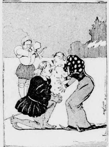
Den Weg durch ihre Nasen fand.