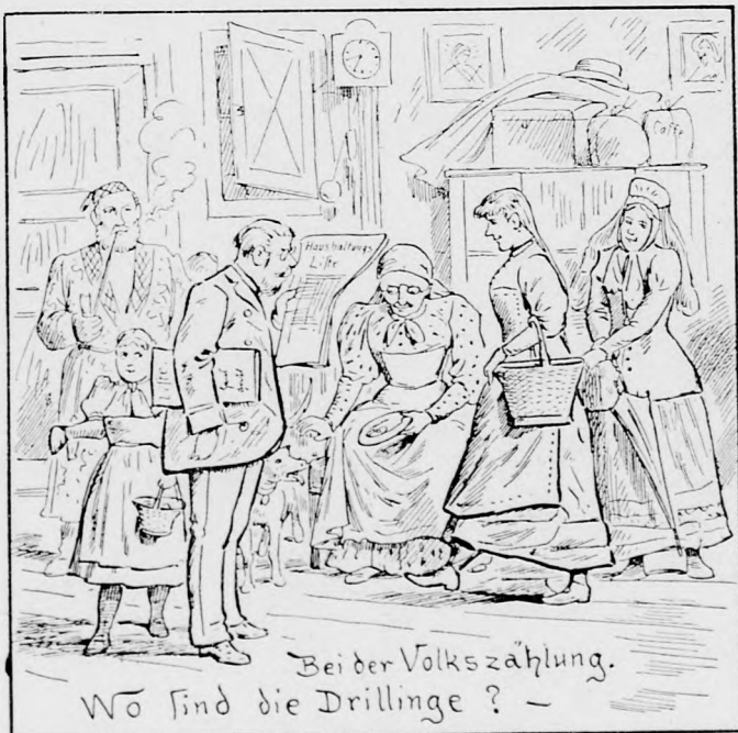
Bei der Volkszählung. Wo sind die Drillinge? -