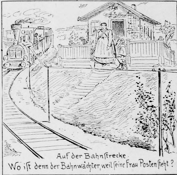
Auf der Bahnstrecke. Wo ist denn der Bahnwächter, weil seine Frau Posten steht?