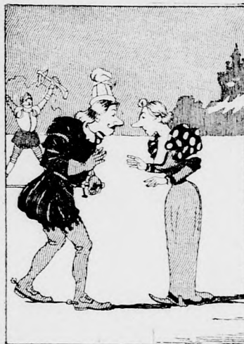
Von Amor's Pfeil ins Herz getroffen