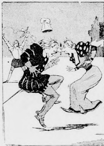
Der Pfeil jedoch des Nebenbuhlers