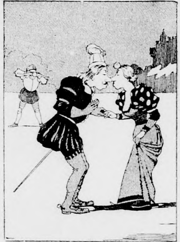
Standen sie liebend, Hand in Hand.