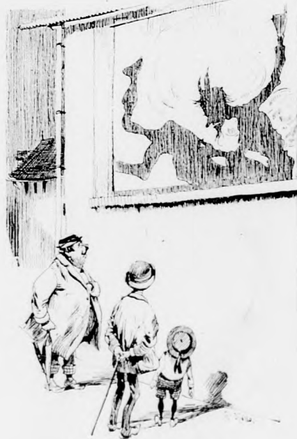
Wie der Schneider Tups