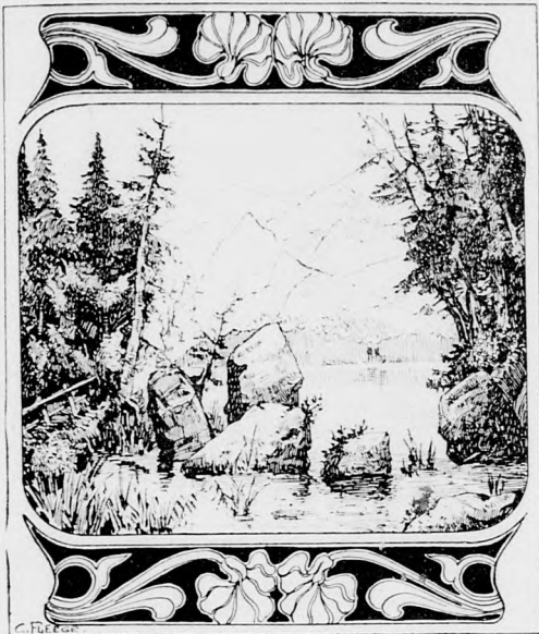
Wo ist denn der Forellenfänger?