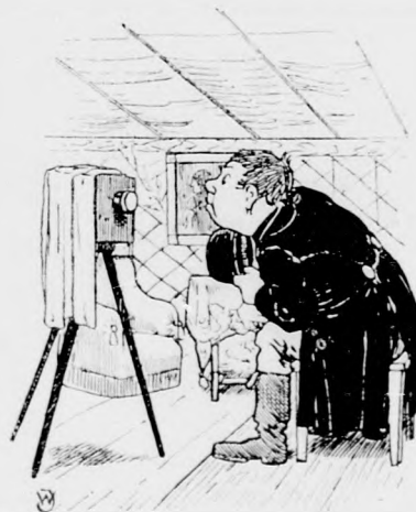
Wo ist der Photograph?