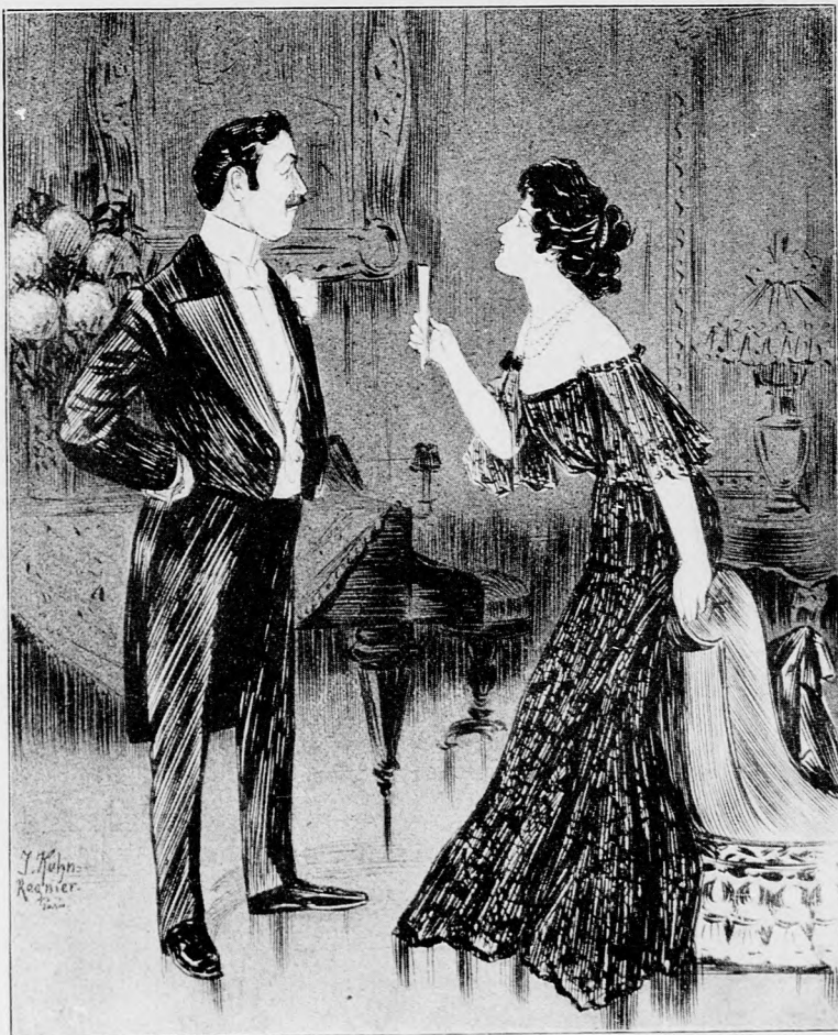
Dame (zu einem lästigen Freier): „Wollen Sie mich wirklich glücklich machen?“ Herr (schwärmerisch): „Gewiß, mit Entzücken.“ Dame: „So, dann verzichten Sie auf mich . . .“