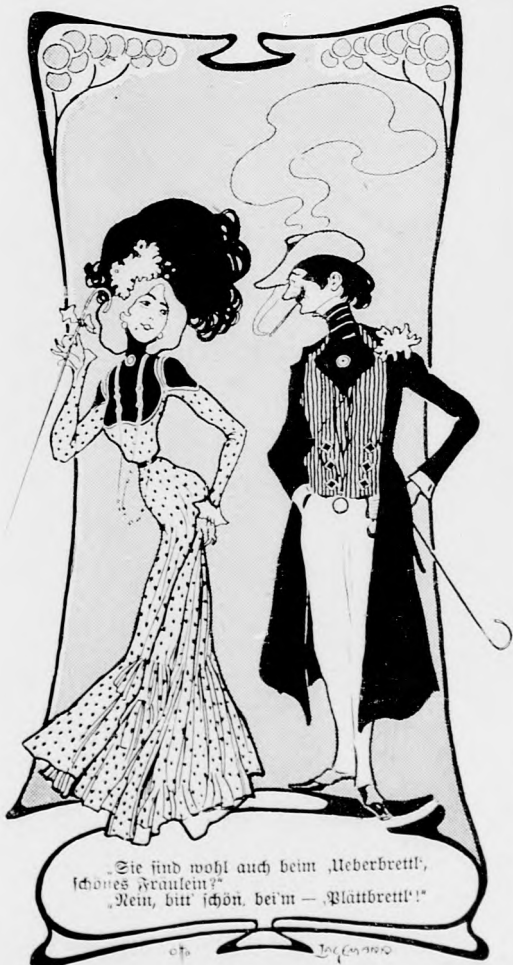
„Sie sind wohl auch beim Ueberbrett, schönes Fräulein?“ „Nein, nur schön, beim — Plaubrett!“