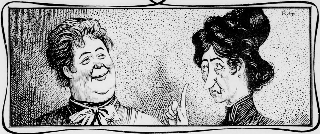
Frau A.: „Meine Köchin ist eine Perle.“ — Frau B.: „Nun, Perlen bedeuten Thränen.“