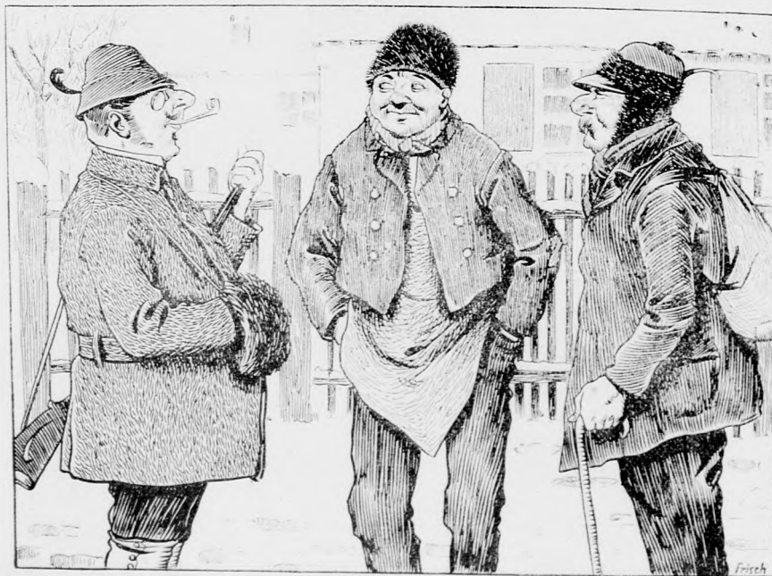
Baron: „Na wie ist die letzte Treibjagd ausgefallen.“ — Treiber: „Schlecht is diesmal gange, Herr Baron, auf oan Hasen sein zwoa ang'schossene Treiber troffen!“