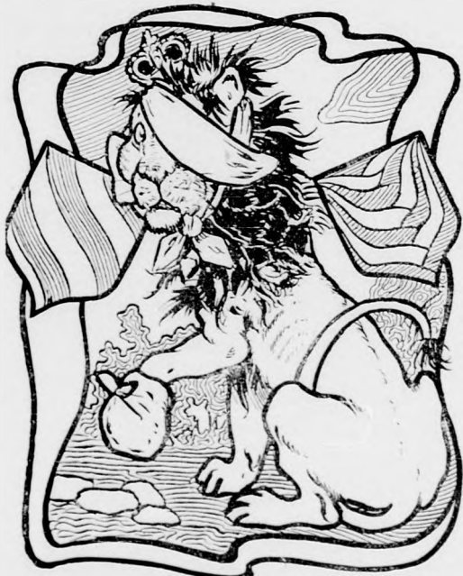
Wo ist Lord Kitchener?