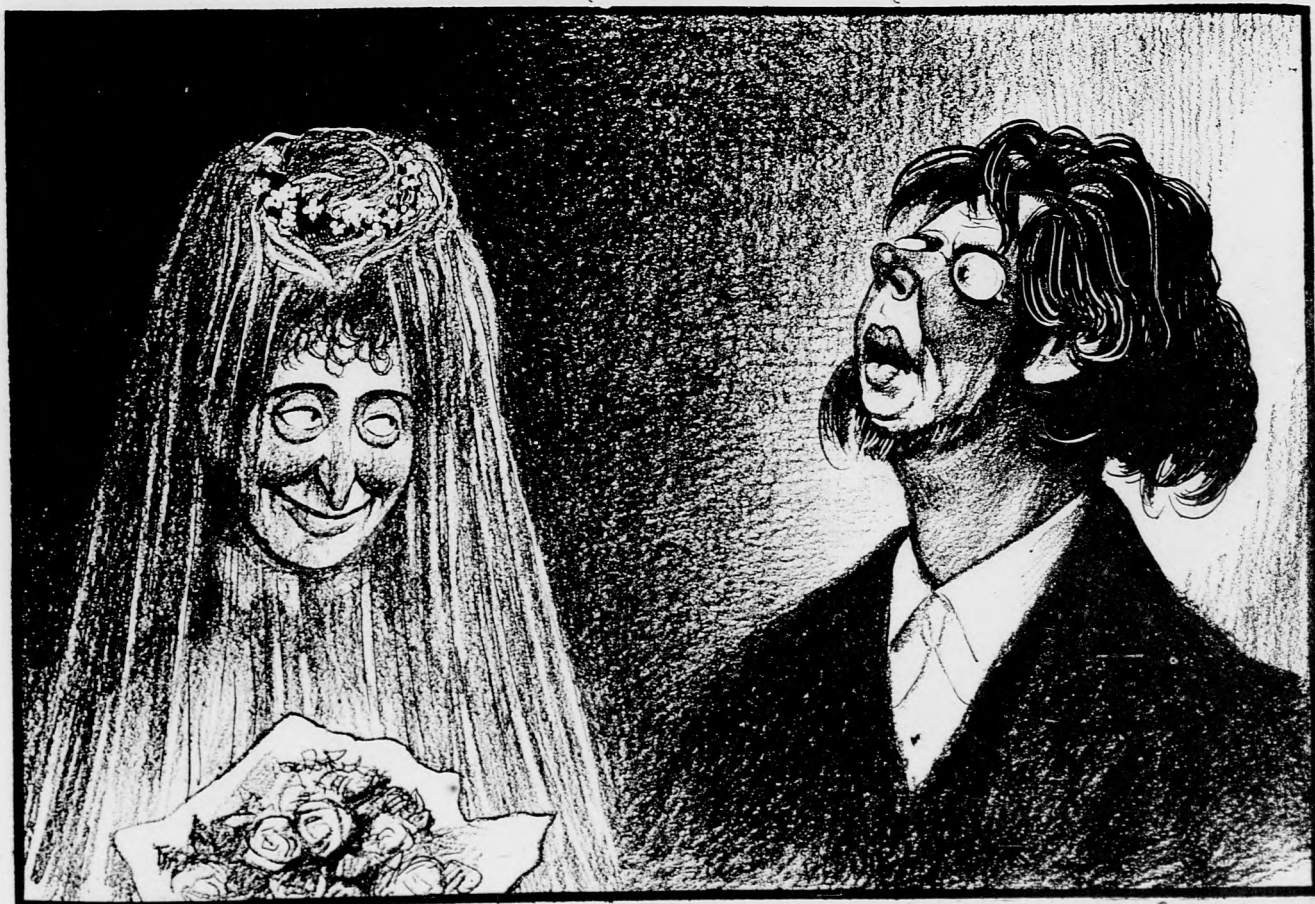
Professor (nach der Rede des Geistlichen zusammenfahrend): „Ich glaube, jetzt habe ich mich in der Zerstretheit verheiratet.“