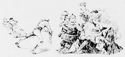
„Sie werden so lange vordrängen,