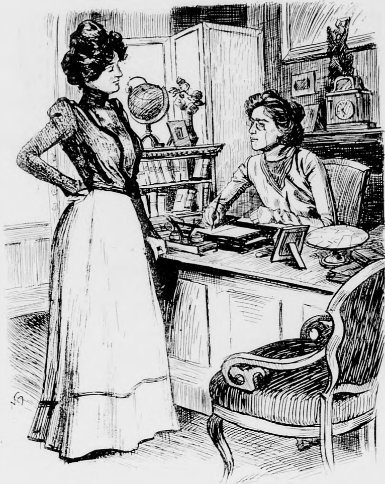
„Gnädige Frau, ich möchte für heute um Ausgang bitten, ich möchte mir nämlich mit meinem Bräutigam meine Saloneinrichtung aussuchen.“