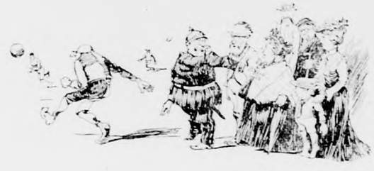
„So, ruhig stehen bleiben!“