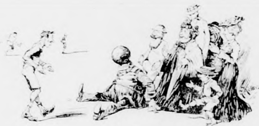
bis noch was Dummes passiert!“