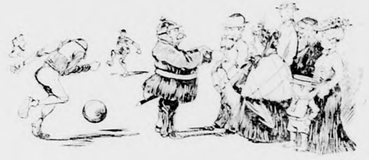
Schumann: „Zurücktreten, immer zurücktreten!“