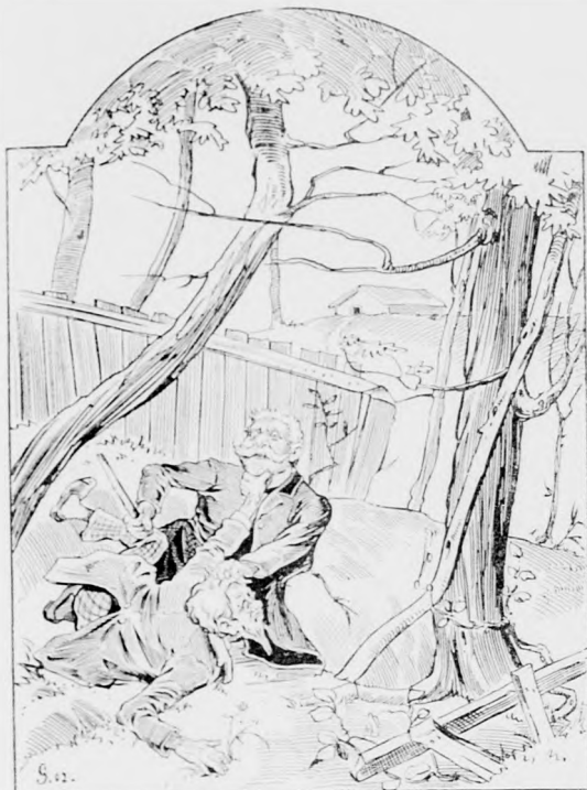
Meinungsverschiedenheit des Vorstandes des Vereins „Eintracht“. Wo steckt der Gendarm?