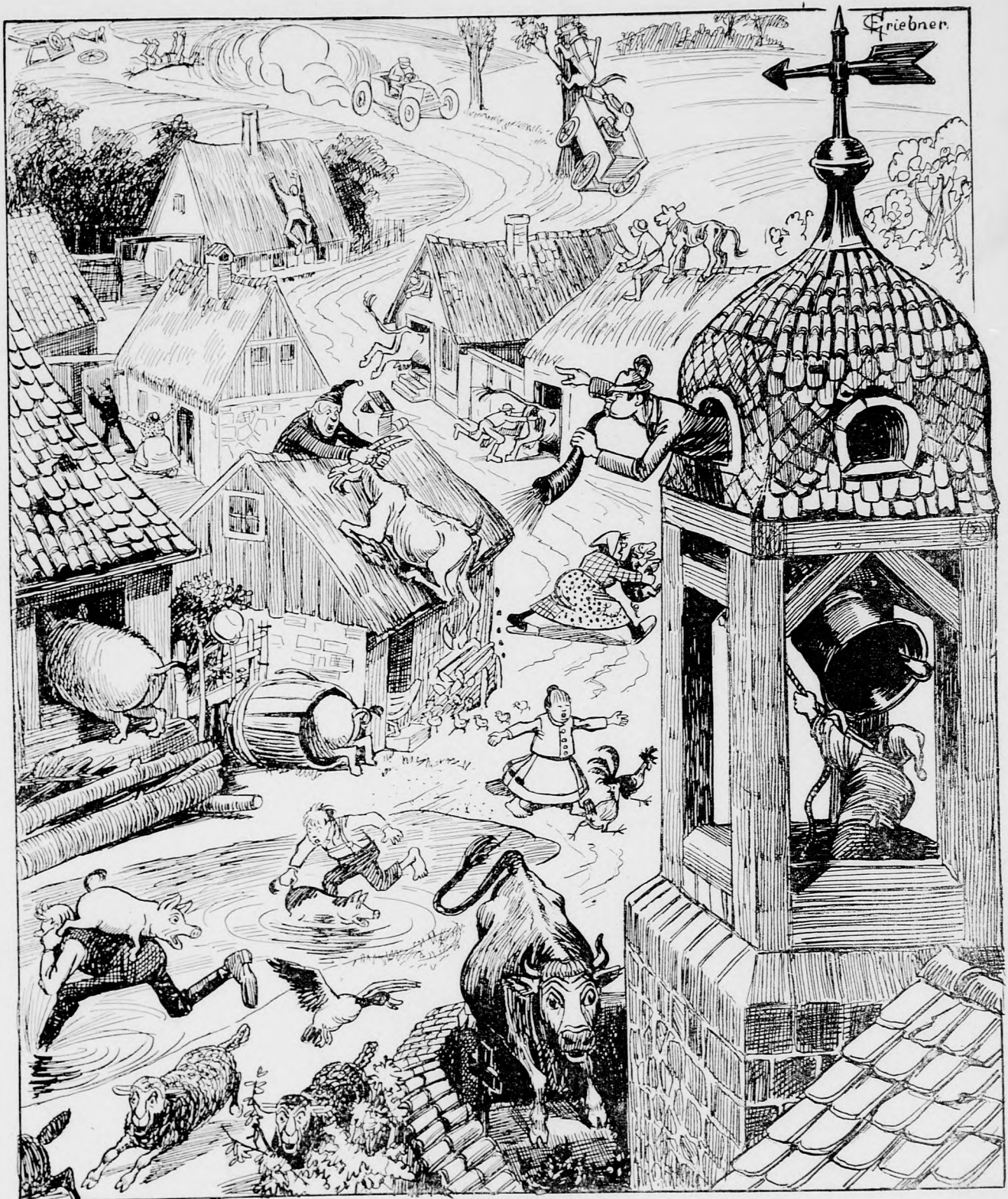
„Sauve qui peut!“