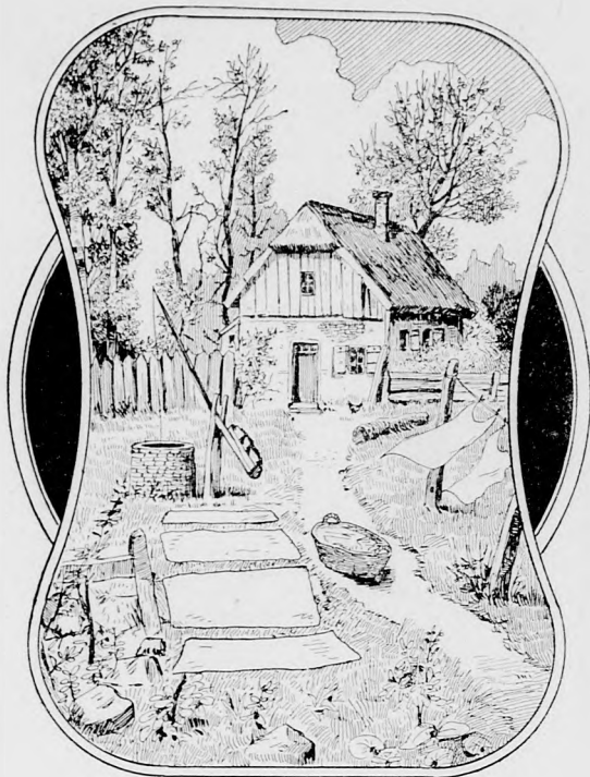
Wo sind die beiden Waschfrauen?