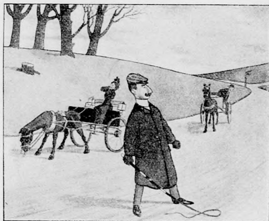
Er: „Gut — laß kommen, was kommen will -- er soll uns nicht trennen!“