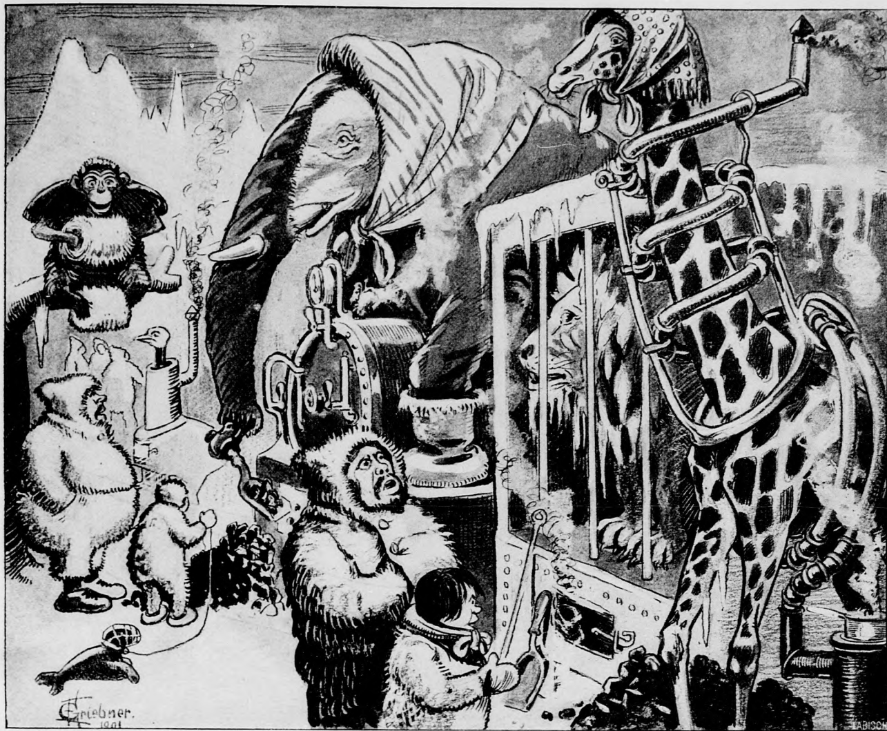
bei den Eskimos.