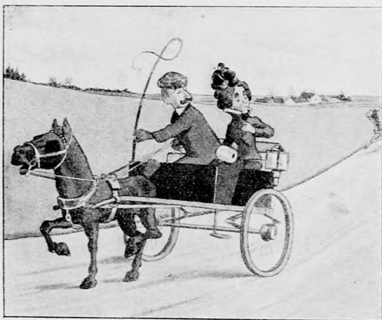
Er: „Was ist los, werden wir verfolgt?“ — Sie: „Um Gottes willen, es ist Papa, laß das Pferd so schnell wie möglich laufen!!!“