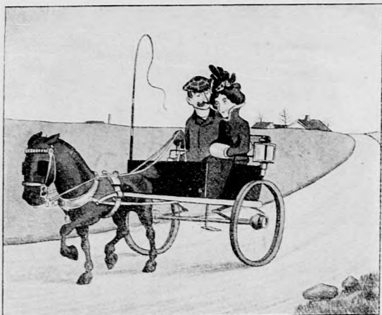
Er: „Meine innigst geliebte Therese, endlich bist Du mein!“