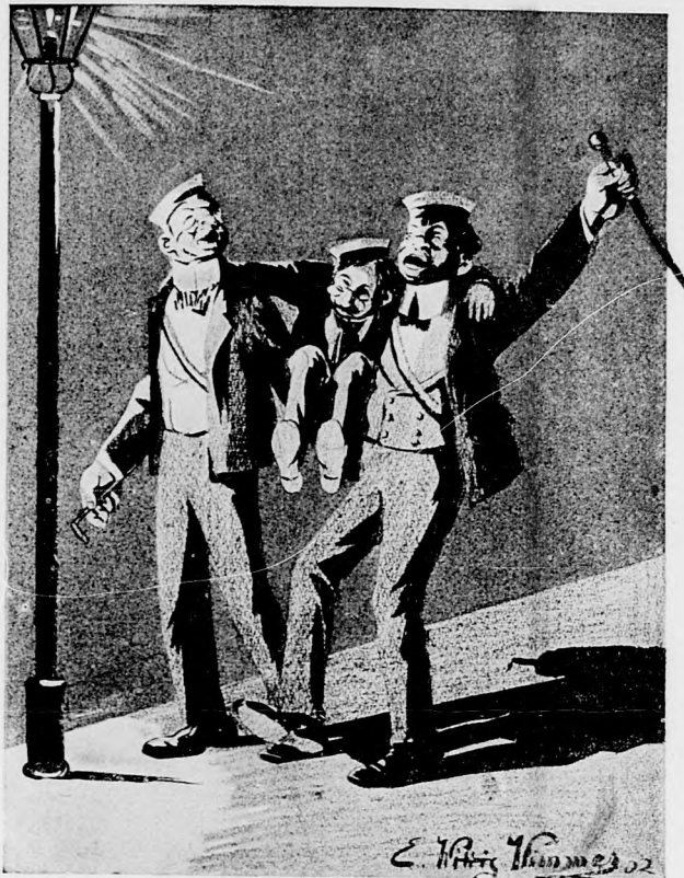
„Na, der weiß schon, warum!“