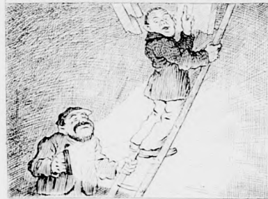
„Du, Ede, da liegt bloß noch ein Teppich vorn Koch.“