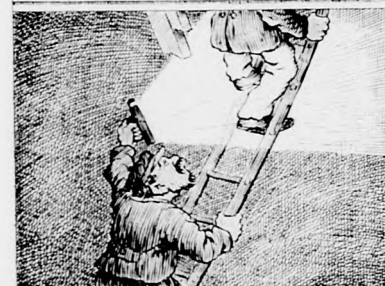
„So hebe ihn doch etwas auf und schau' nach, was im Zimmer ist.“