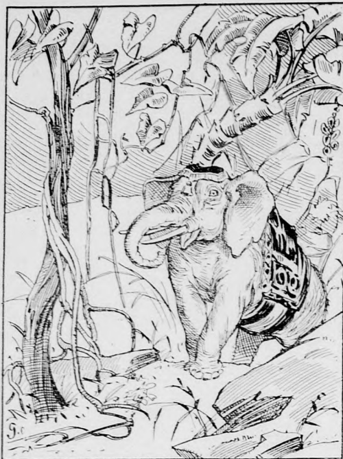
Wo ist der Führer?