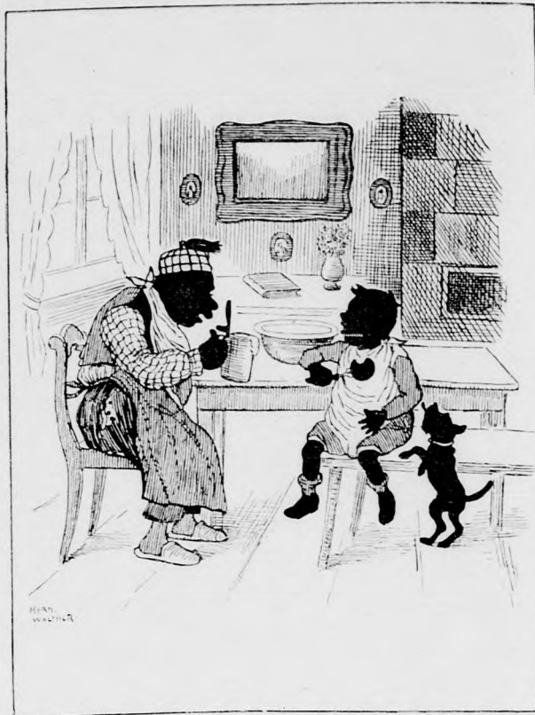
Junge (nachdem er ein Duzend Leberknüdel gegessen hat): „Bata, nu kann ich nicht mehr, nu plagt mir die Seele.“