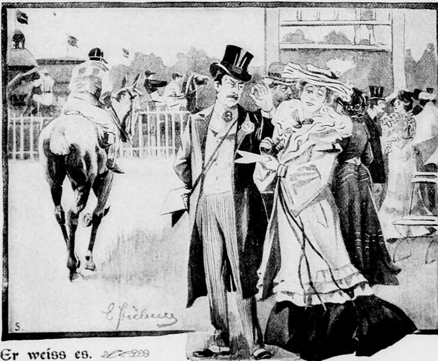
Er weiß es.

Der Dumme hat das meiste Glück. Deshalb schweige, wenn Dir 'mal welches widerfuhr!