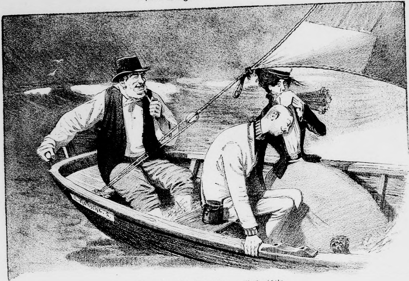
„Sie werden wohl seekrank?“ — „Noch nicht!“