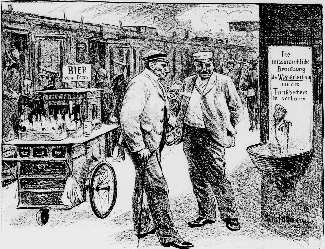
„Das ist vernünftig, daß die Behörden endlich mal das Wassertrinken verbieten!“