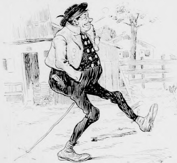
Bauer (der wegen einer Ohrfeige verklagt, aber freigesprochen wurde): „Dös g'freut mi für 'n Sepp, daß i wegen dera Ohrfeigen freikomme bin, jetzt hab' i, alleweil' a Batzchen in der Hand für eam!“