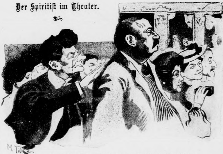
„Sie, setzen Sie sich, Sie haben noch keinen Astralleib.“