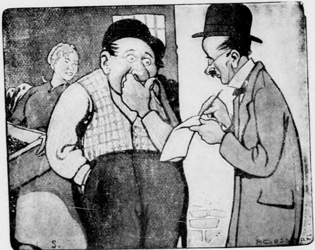
Beamter: „Wie alt ist Euer Kalb, Wurzelbauer?“ „Holt sechs Monate, drei Tage und vier Stunden.“ Beamter: „Wie alt ist Eure Tochter?“ „Sejjas, wann ich dös wist?“