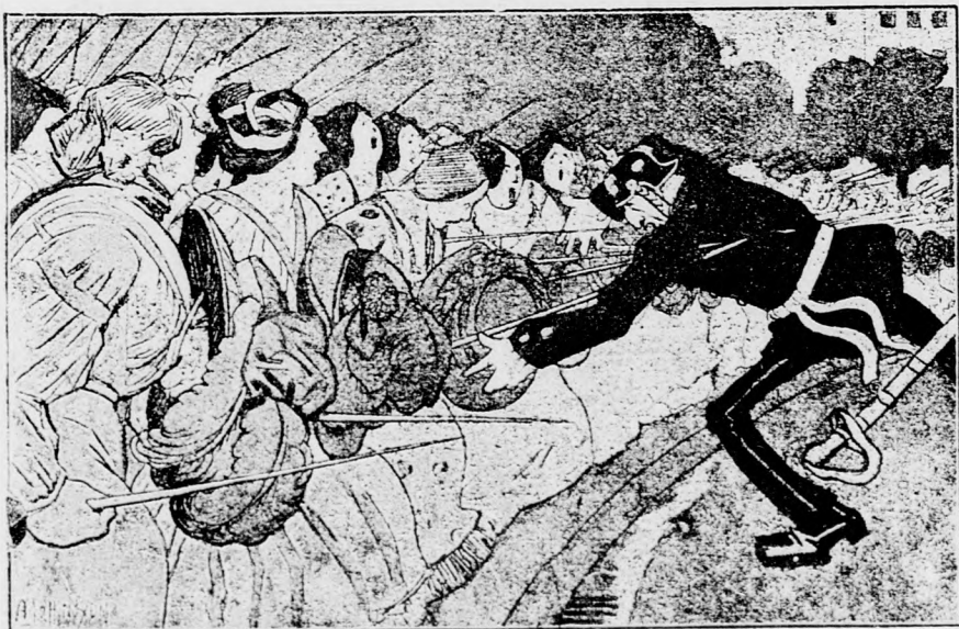
Der Kampf der Damenwelt gegen die Berliner Polizei-Hutmadel-Verordnung.