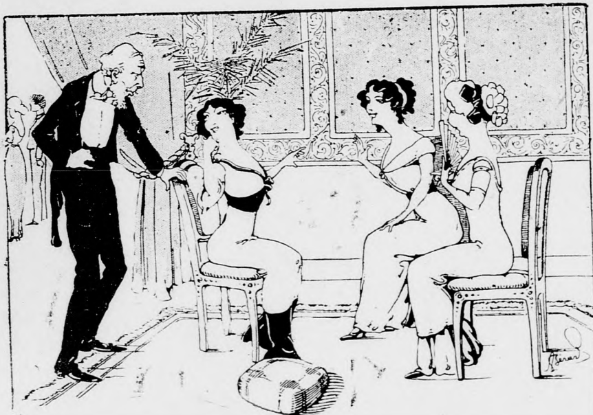
(der betreffende Affe tritt eben ein) Darf man den liebenswürdigen Gesprächs- stoff mit anhören?