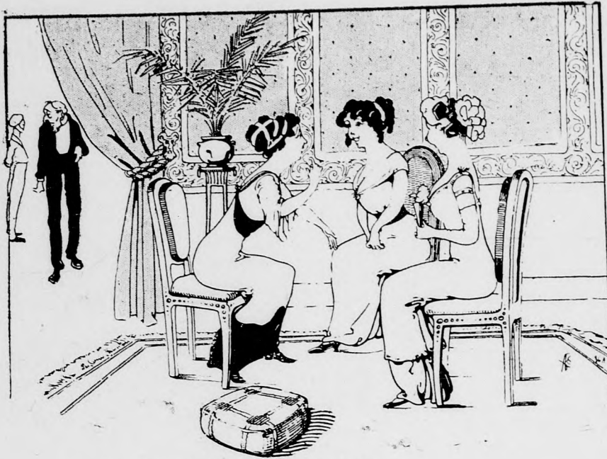
... Ja, und denkt Euch der häßliche Affe ...