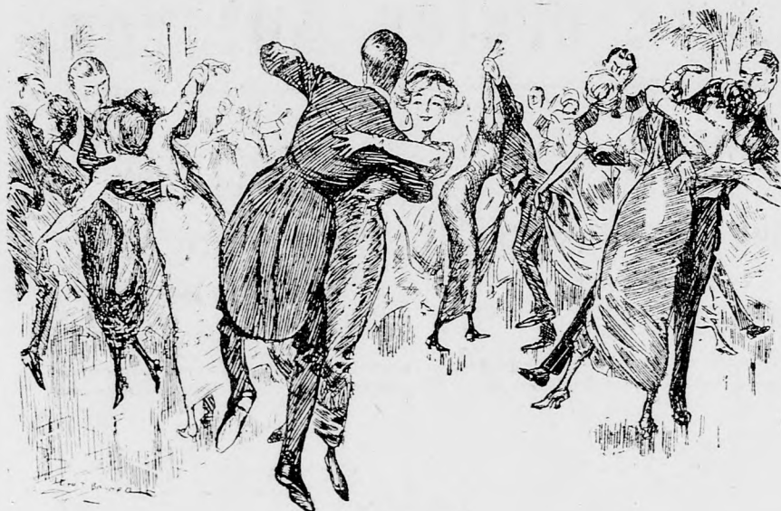
— Ach wie herrlich, ach wie schön Sich im Reigen zu drehn . . . — Da kann einem die Lust vom Tanzen vergehn.