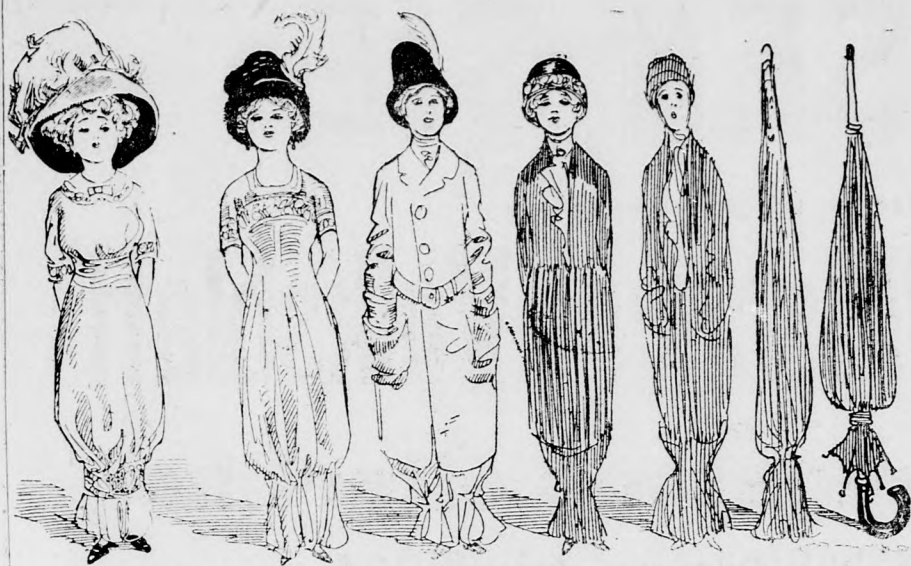
Wie eine moderne Dame zum unmodernem Regenschirm wird (oder auch ungekehrt).