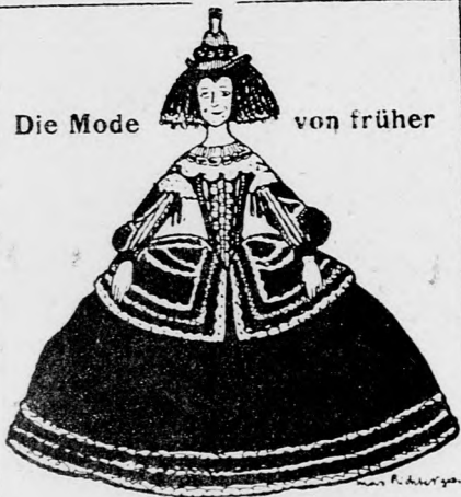
Die Mode von früher

„Daß du dich nicht etwa verschauft, Erna!“