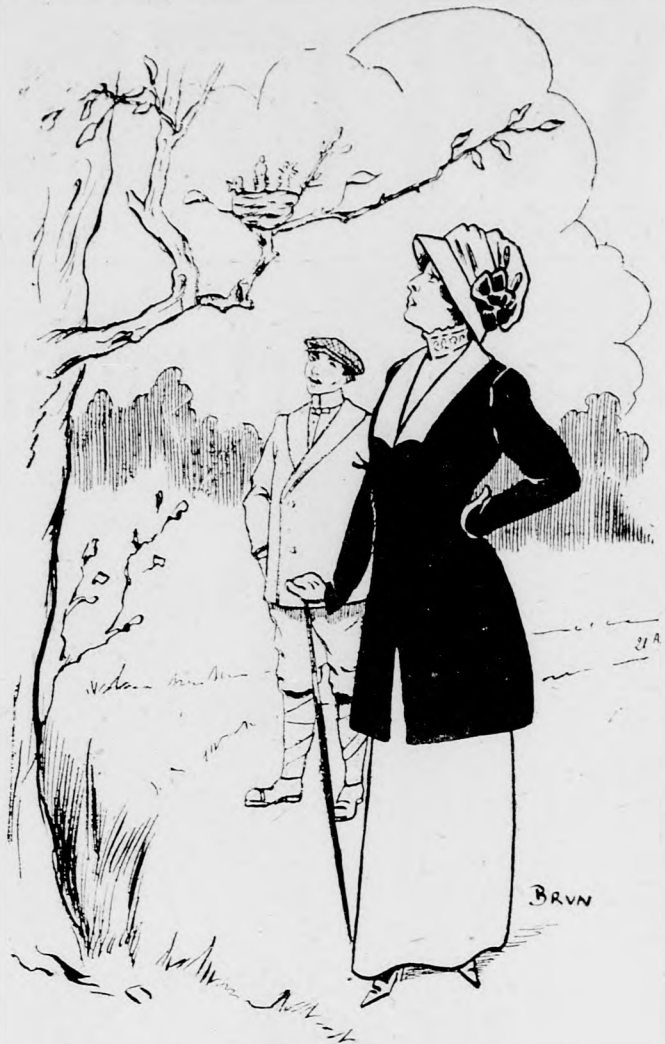
Junger Chemann (auf der Hochzeitstreife).

am Samstag, den 9. März 1912 veröffentlicht.