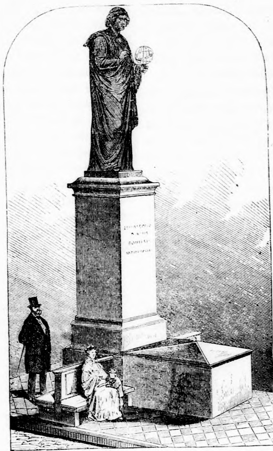
POMNÍK M. KOPERNIKA V TORUNI.

„Práve preto je cisár prinútený svoje vy- skúsené vojsko, ktoré nás až posial držalo