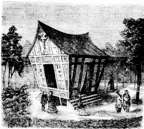
II. ČÍNSKY PAVILLON.

Dejepisné práce jeho vzbudily v kruhu učencov a hlavne historikov veľkú pozornosť, tak že i — jako už spomenuto — „Kráľovská česká spoločnosť nauk“ pre zásluhy na poli historie Uhorska dňa 7. Dec. 1870 ho svojim dopisujúcim členom menovala. Avšak jeho historické studia niesú ob-