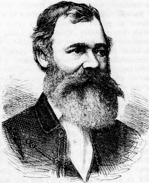
Dr. Svetozár Miletič.