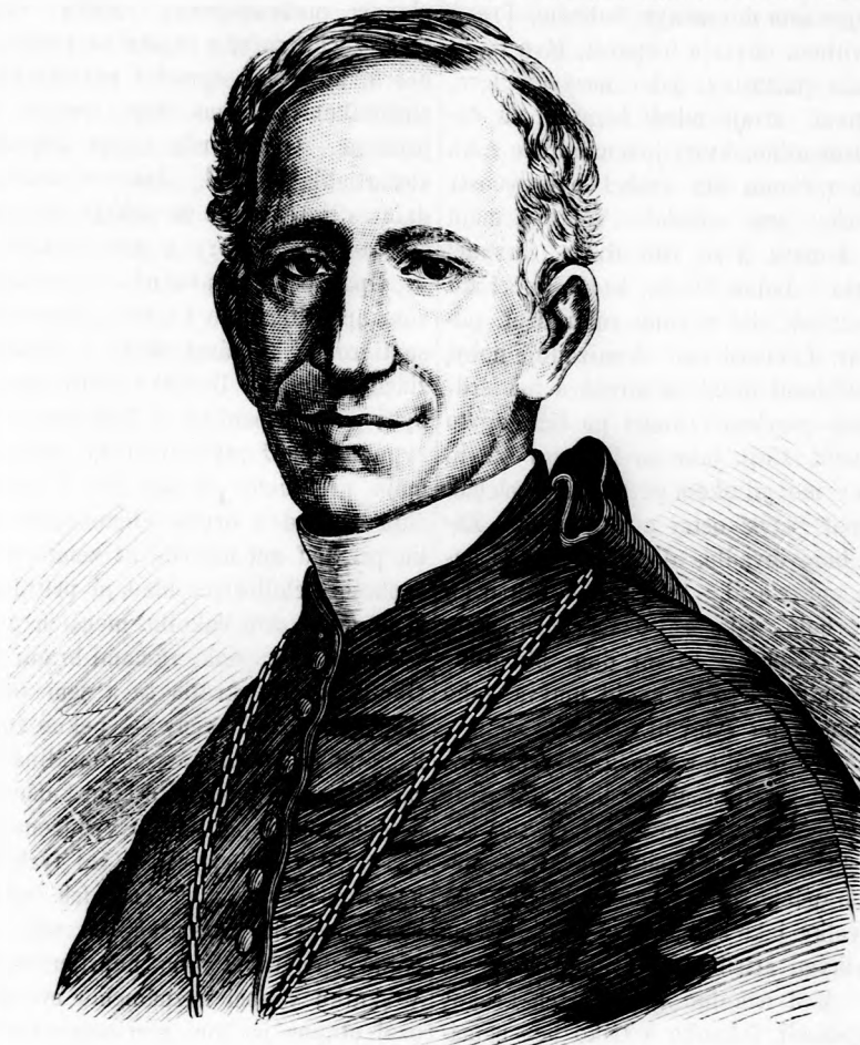
Pápež Lev XIII.

Za týmto oddielom stojí hospodársky dom, či majer, a v jeho susedstve rozprestierajú sa sady rozličných bylín, stromov a kriakov.