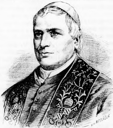
Pápež Pius IX.