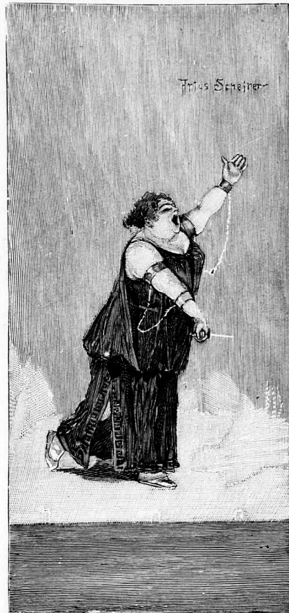
„Ein Elefant, der eine Nachtigall verschluckt hat.“

„Nun, was sagen Sie zu unserer Primadonna?“