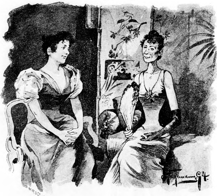
Altes Mädchen: „Endlich hat Doctor Klaus angebissen!“ Ihre Freundin: „Ja, aber wo denn?“