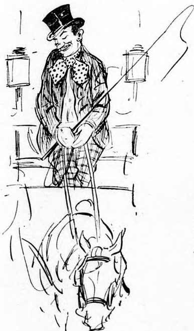
wenn er einen gewöhnlichen Passagier fährt,