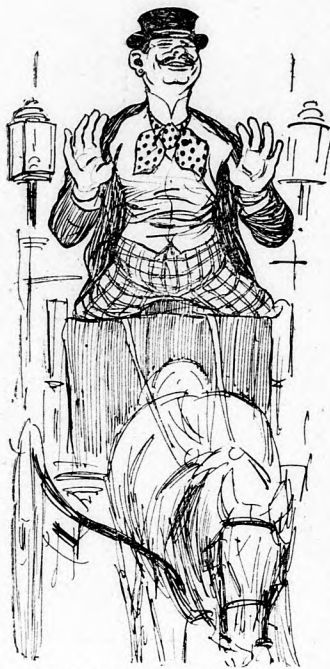
wenn er einen Cavalier fährt,