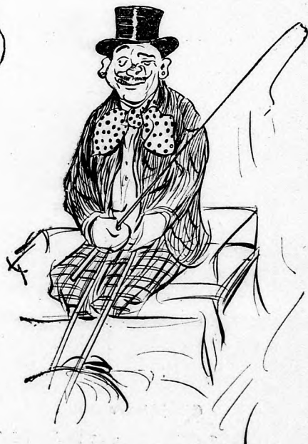
wenn ein Liebespärdchen im Wagen sitzt.