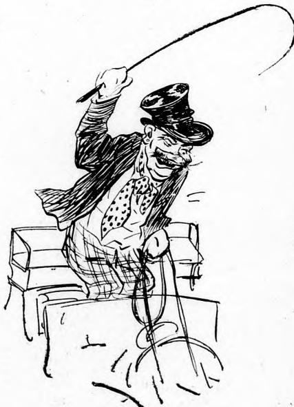
wenn er einen Betrunknen fährt,