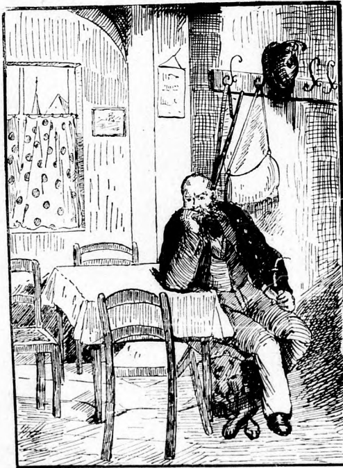
Wo ist die Frau Försterin?