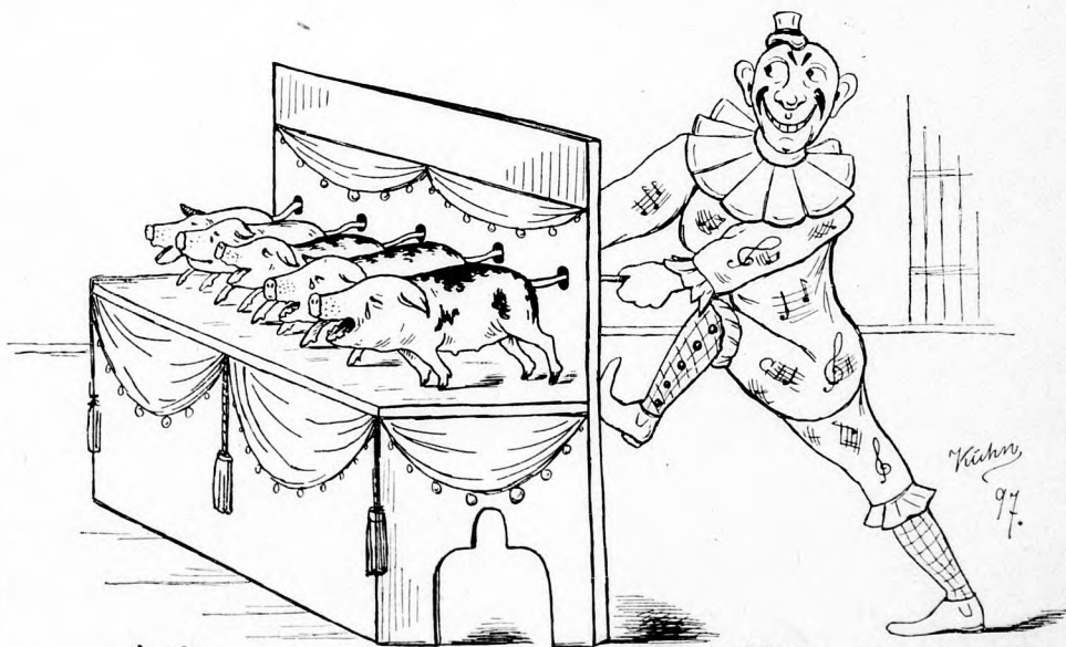
Ein musikalischer Clown.

Rekrut: „Dann thut er 'ne schallende Ohrfeige kriegen!“