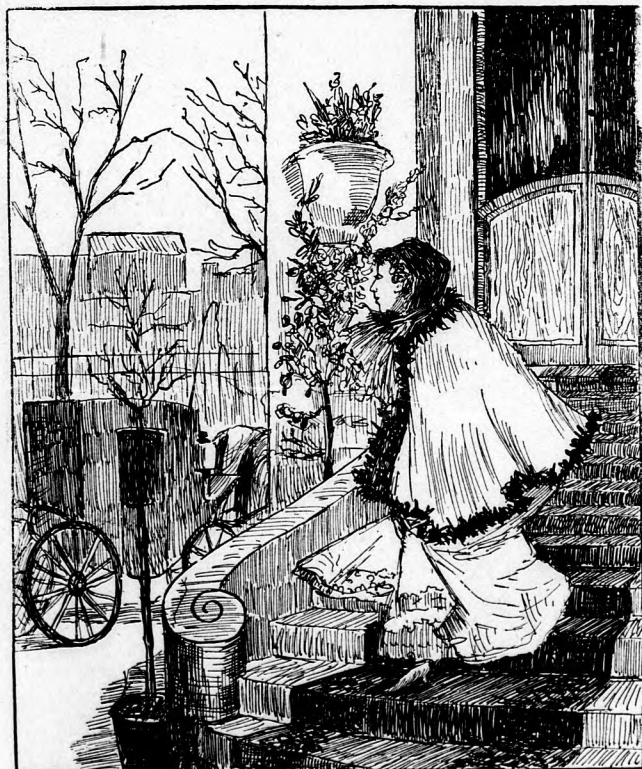
Wo nur der Kutscher bleibt?