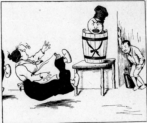
4. Herr des Himmels! Schwerenot! Von dem Schreck sind Beid' halbtot, Und so schnell die Beine tragen, Sie entsetzt von dannen jagen.