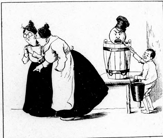
5. Schwapp ist schon die Kiepe weg Und geklatscht wird auf dem Fleck; Fritz nutzt seinen Vorteil schlau Und malt hurtig 'nen Baubau!