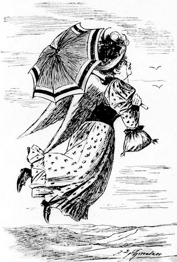
— — — und auf den Flügeln der Liebe eilte sie ihm entgegen.“