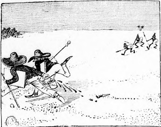
Drei Schwarze nahen und voll Schrecken Thun flips und Klips sich schnell verstecken.