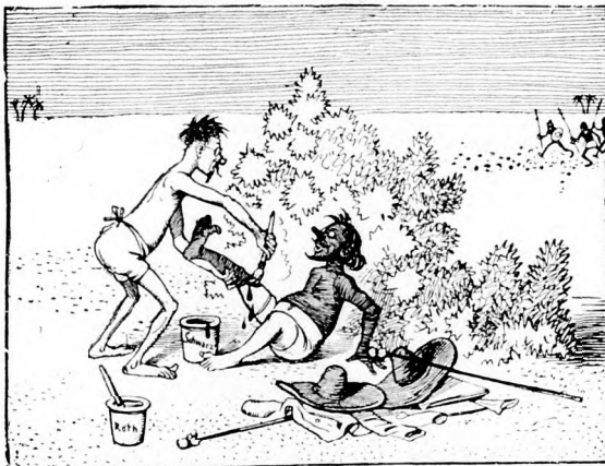
„Nur Mut!“ rief Klips, „wir woll'ns probieren Uns und die Schwarzen anzuschmieren!“