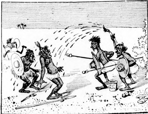
Und vor den Wilden mit dem Pinsel Die Schwarzen fliehn mit Angstgewinsel!