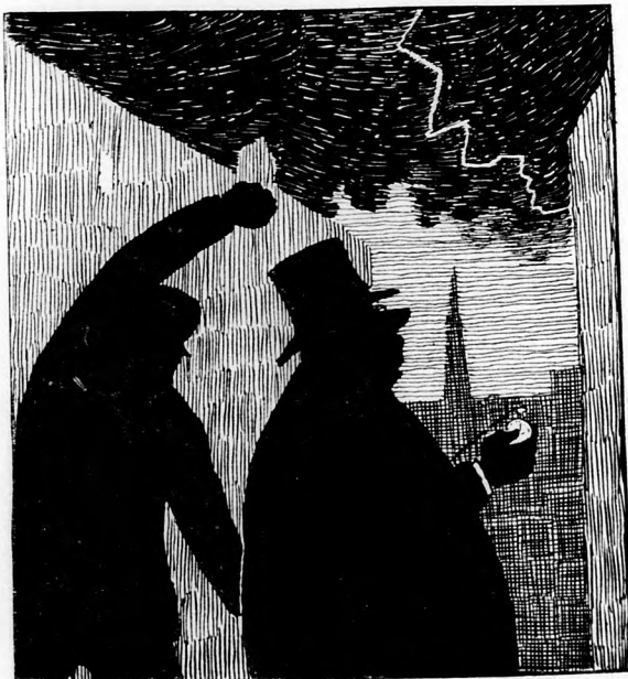
2. Blitz — 1, 2, 3 Sekunden — hm, das Gewitter ist ja kaum 1 Kilometer entfernt. 3. Blitz — gleich darauf betäubender, greller Donnerschlag — hm, die Zeit zwischen Donner und Blitz gleich Null, ergo war der Blitz in unmittelbarer Nähe, außerdem sagt mir das knatternde Geräusch dabei, daß es jedenfalls — — —