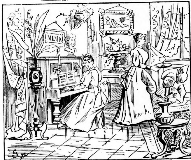
Wo ist Papa?