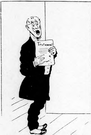
Heut' vom Erbe ausgeschlossen