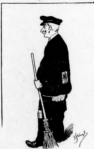
Morgen fegt er Höfe ab.