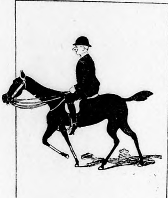
Gestern noch auf stolzem Rosse