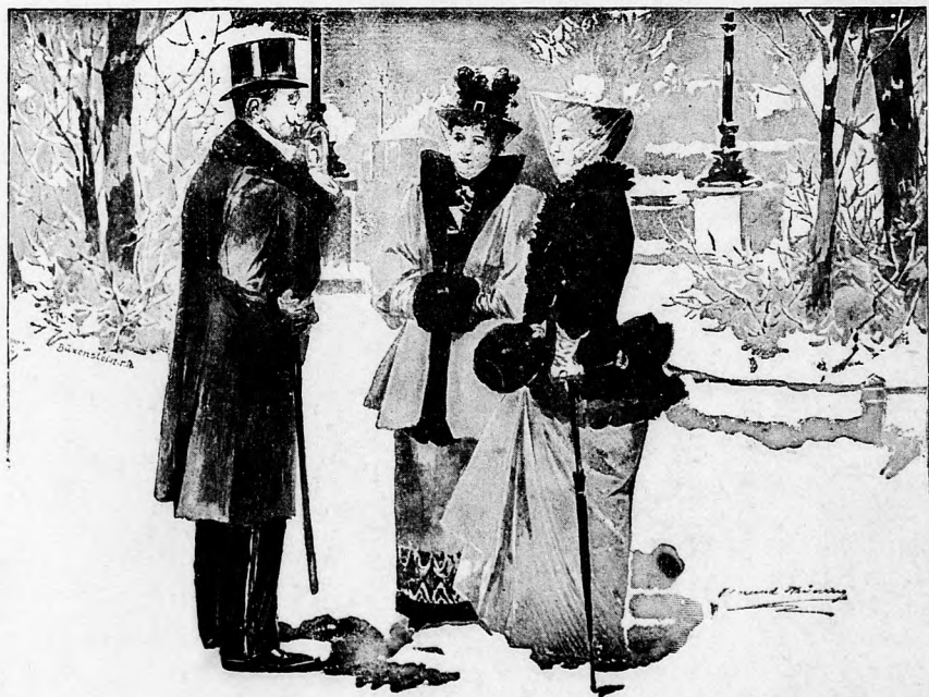
— „Welche von Ihnen Beiden älter ist? O, das ist sehr schwer zu sagen!“