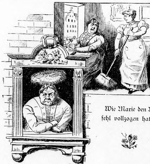
Wie Marie den Befehl vollzogen hat.