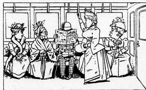
Hier kam der letzte Zustand vor, Die Frauen drohen mit Rumor.