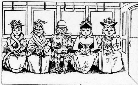
Vergnügt ist auf der Pferdebahn Wer zwischen Damen sitzen kann.