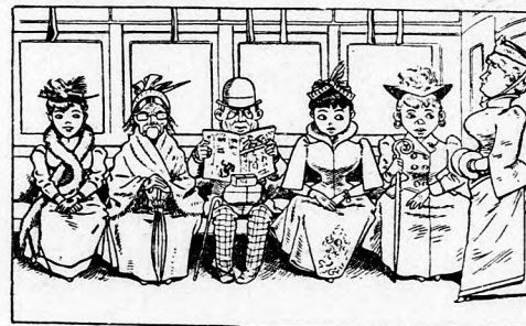
Dagegen ist es unausstehlich, Wird eine Dame überzählig.