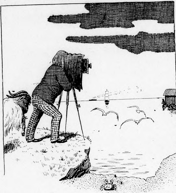
„Ah, das nette Kind dort drüben! Das soll eine Aufnahme werden, die sich

Diener: „Ja, gnädiger Herr, das finde ich auch, der Zigarrenlieferant muß uns schön betrogen haben!“