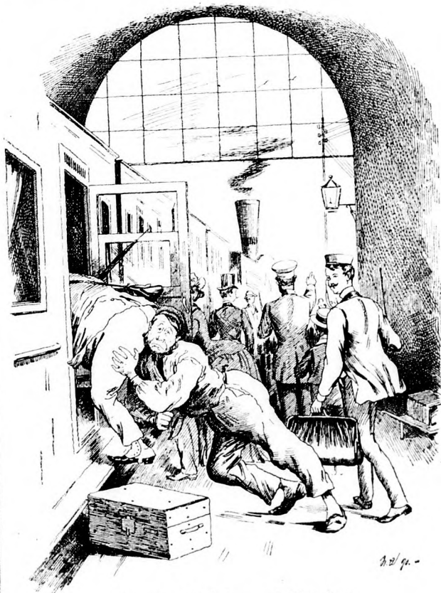
Wie der Arbeiter geholfen hat.

Ein dicker Herr will in einen Eisenbahnwagen einsteigen. Als ihm dies nicht gelingt, ruft er einem Arbeiter zu: „Sie, Mann, hier haben Sie zehn Pfennige, helfen Sie mal mit.“