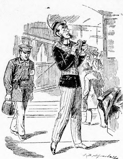
wenn ein Engländer