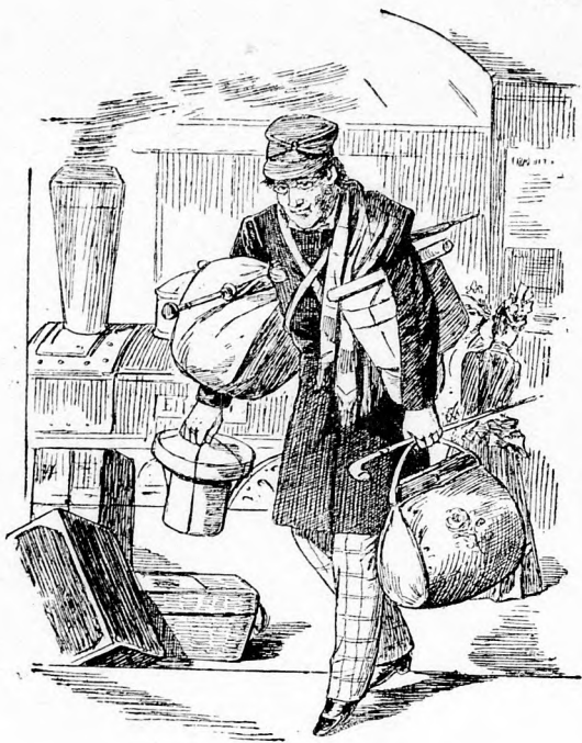
wenn ein deutscher Philister