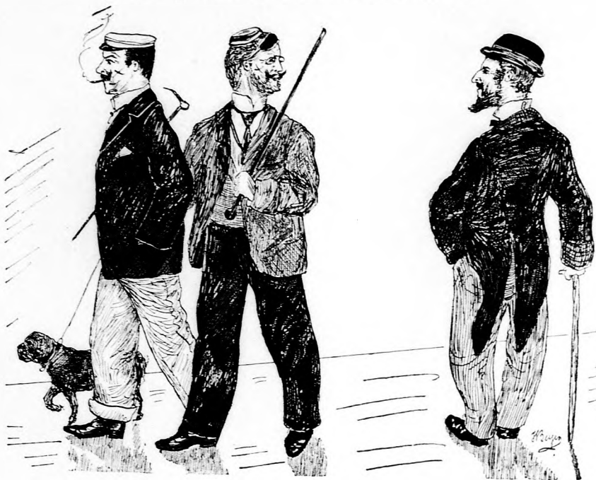
Student und Herr (jeder für sich): „Herrgott, sieht der verrückt aus!“