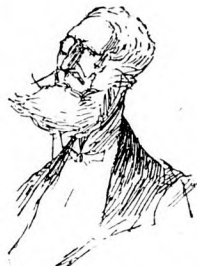
Eine vornehme Erscheinung von edlem Charakter.