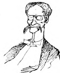
Ein Mann in den besten Jahren.