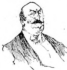
Ein gesetzter Mann von angenehmem Äußern.