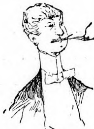
Ein hübscher junger Mann, dem es an Damenbekanntschaften mangelt.

Aus dem Offerten-Album eines Heirats-Vermittlungs-Comptoirs.