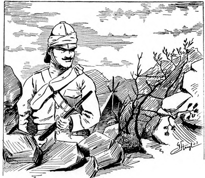
Wo ist der Zukunfrierer?