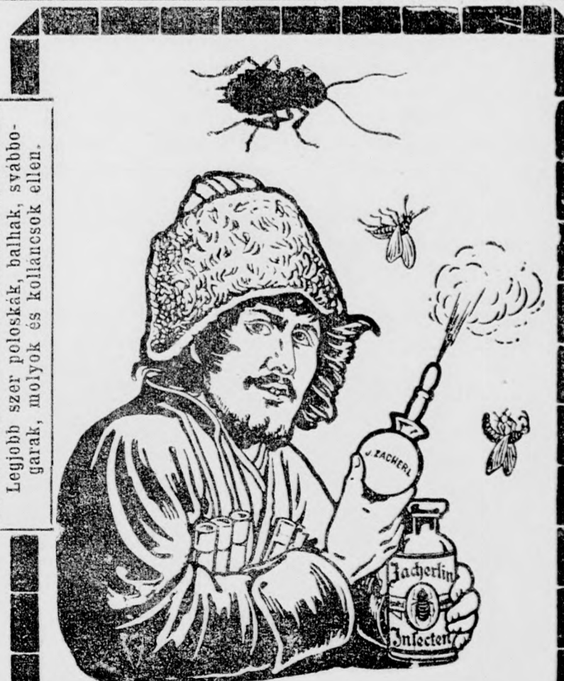
Legjobb szer poloskák, balhák, svábhogarak, molyok és kollarcsók ellen.