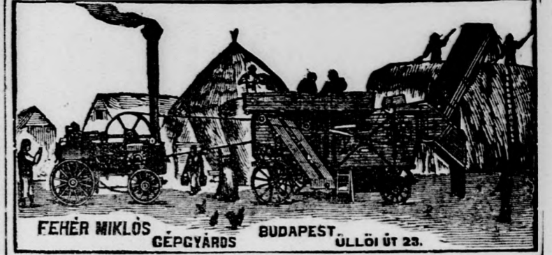
FEHÉR MIKLÓS GÉPGYÁRS BUDAPEST, ÜLLŐI ÚT 23.

továbbá a legújabb szerkezetű magánjárókat és mindennemű egyéb gazdasági gépeket u. m.: ekéket, boronákat, hengereket, vetőgépeket, (cirkulár) kör-fűrészeket, malomberendezéseket, trieurókat, darálókat, a legjobb peronospora-fecskendőket, szecskavágókat, bakkerrostákat stb. stb. kedvező fizetési feltételek mellett legjutányosabb áron, hitelképes vevőknek több évre terjedő részletfizetésre.