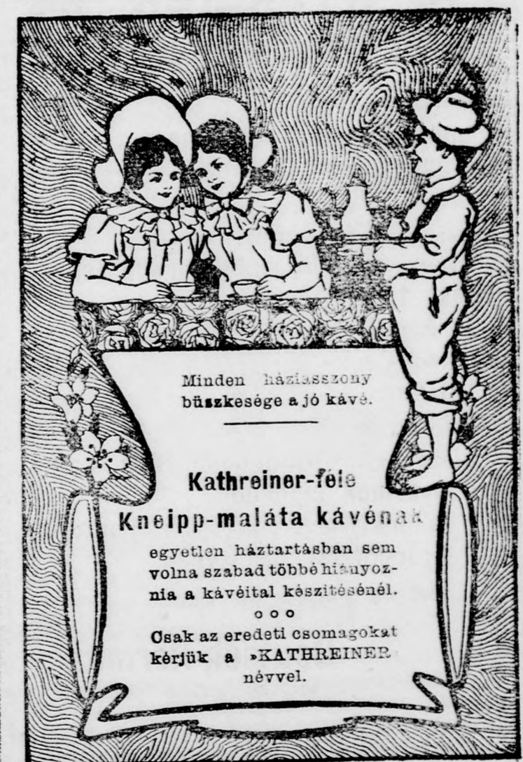
Ung. Ib. 1905.