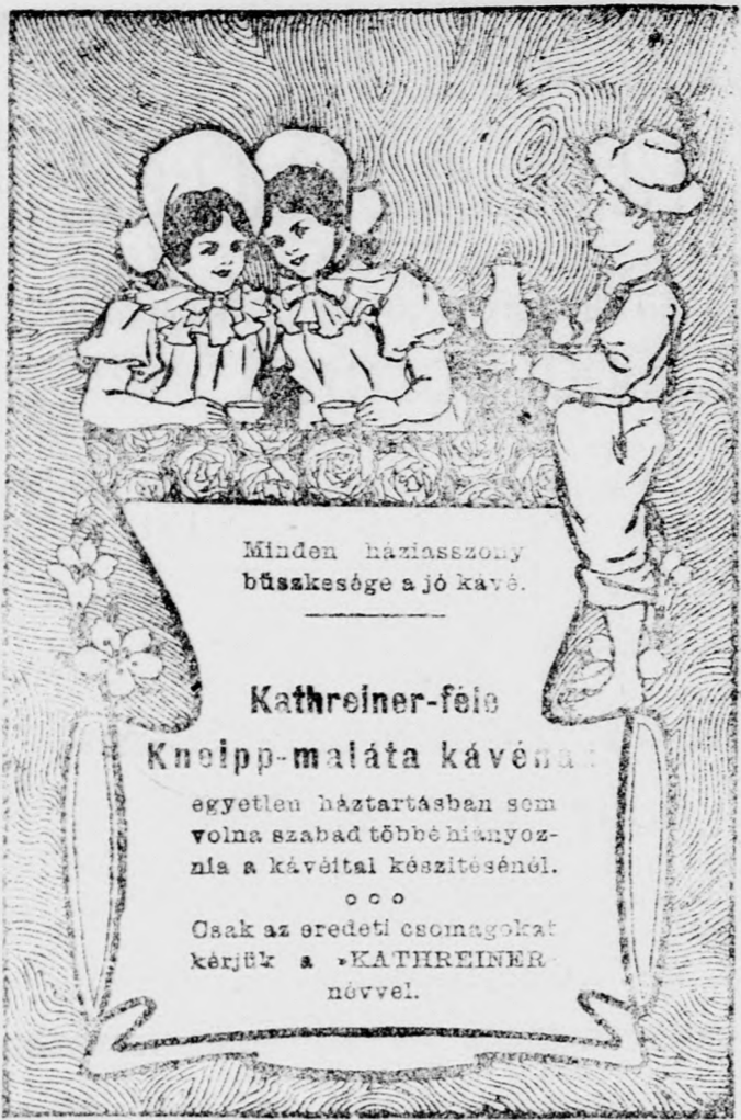
Leg. 13. 1906

Piaci áraink a legutolsó het ivásávan 50 kilogrammonkin