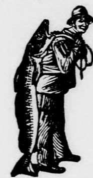
Az Emulsió vásárlá-sánál a SCOTT-féle módszer védjegyét — halászt — kérjük figyelembe venni.

akár szervezeti fejletlenségből, akár betegségből származnék, gyorsan gyógyít a SCOTT-féle Emulsió, melyet tökéletes táp-gyógyszernek lehet nevezni, mert rendkívül hatásos a gyógyereje s emellett